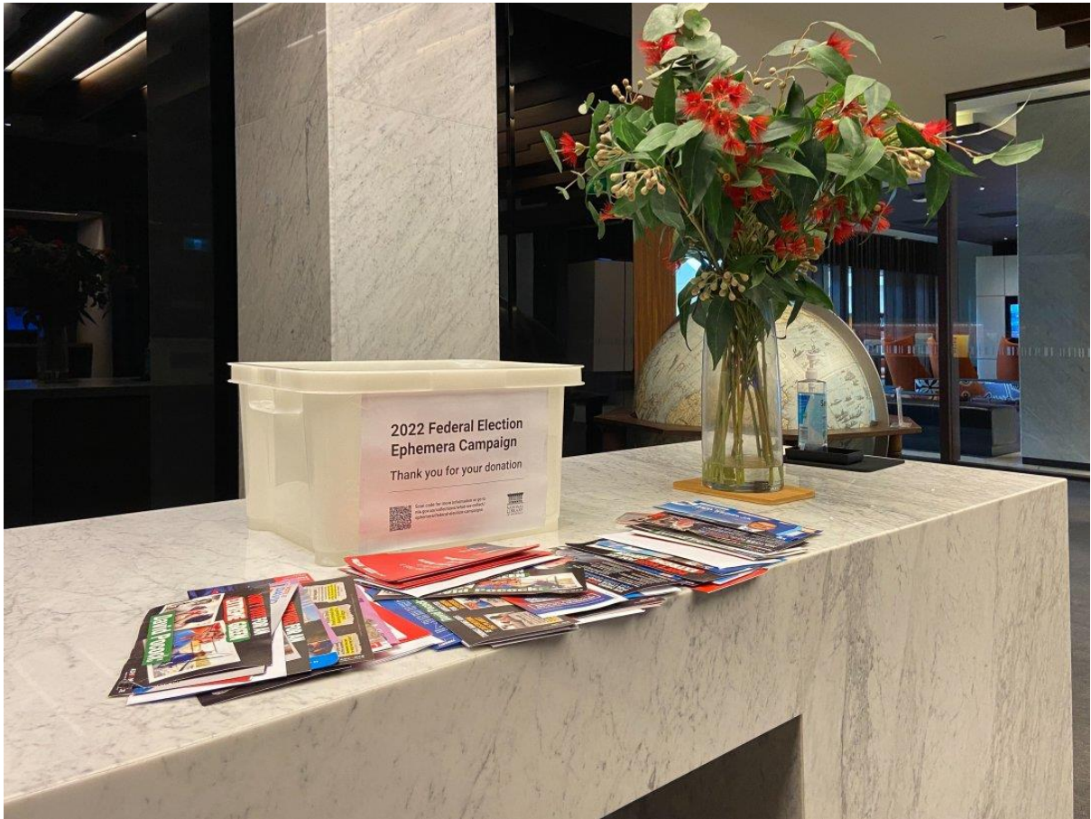
2 मुख्य वाचनालय में पुस्तकालय की संग्रह पेटियों में से एक पेटि

यह आह्वान कई तरह से होता है - हमारी पुस्तकालय संग्रह वेबसाइट , सोशल मीडिया मैसेजिंग और मीडिया के माध्यम से, और साथ ही यह पुस्तकालय के सेवार्थियों और समर्थकों पर भी निर्भर करता है। इसके अतिरिक्त हम उम्मीदवारों और राजनीतिक दलों को सीधे आग्रह पत्र भेजते हैं। पुस्तकालय के कर्मचारी व्यक्ति-विशेषों और पार्टियों से सीधे संपर्क करने के लिए प्रासंगिक संपर्क जानकारी खोजने में व्यस्त हैं। कुछ विवरणों को खोजने में प्रमाणित कठिनाई होने के कारण हम उतने उम्मीदवारों और पार्टियों तक नहीं पहुंच पाएंगे, जितना हम चाहते हैं। यह लोगों और समुदायों के काम को जमीनी स्तर पर महत्वपूर्ण बनाता है - हमें अपने उम्मीदवारों से संबंधित अभियान सामग्री को भेजकर वे यह सुनिश्चित करने में सहायता कर सकते हैं कि पुस्तकालय के पास इस अभियान का संपूर्ण दस्तावेजी रिकॉर्ड है।