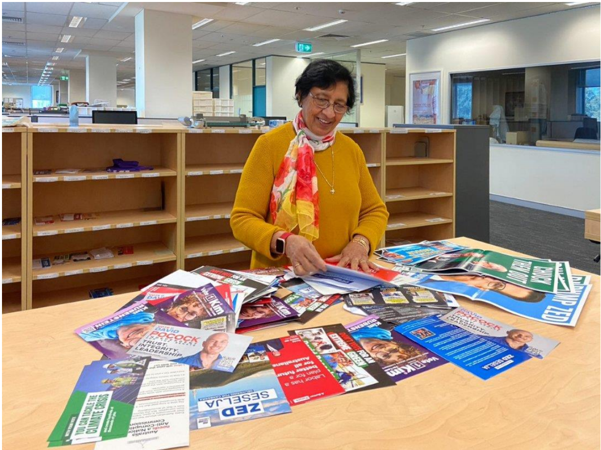
1 एक स्टाफ सदस्य 2022 संघीय चुनाव अभियान सामग्री को देखता है

पुस्तकालय 1983 से इस स्थल में व्यापक रूप से संग्रह कर रहा है और ऑस्ट्रेलिया में राजनीतिक अभियान सामग्री का सबसे बड़ा संग्रह रखता है। सामग्री एक समय के राजनीतिक परिदृश्य - नीतियों, पार्टियों और व्यक्तित्वों - का एक अनन्य परिप्रेक्ष्य प्रदान करती है और उन मुद्दों तथा चिंताओं का 'राष्ट्रीय सैपशॉट' प्रदान करती है, जो हमारे लिए एक राष्ट्र के रूप में महत्वपूर्ण हैं। यह पुस्तकालय 2022 के संघीय चुनाव अभियान का दस्तावेजीकरण करके इस मूल्यवान संसाधन का निर्माण जारी रखने के लिए उत्सुक है, जिसमें 1901 के फेडरेशन से जुड़ी वस्तुएँ भी शामिल हैं।