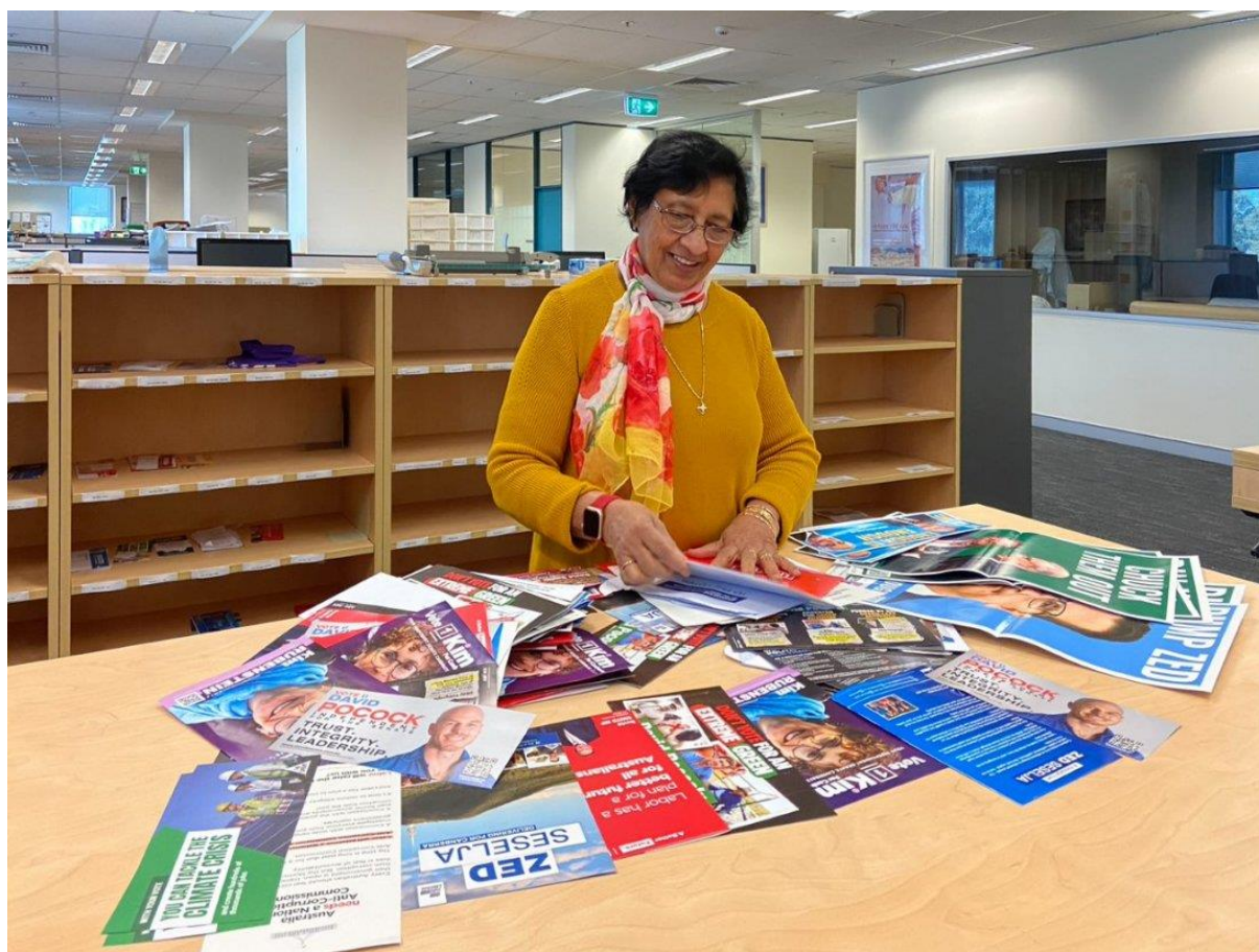
1 一名工作人员正在查看 2022 年联邦竞选材料

自1983年以来，该图书馆一直在这一领域进行全面的收集，形成了澳大利亚最大的政治宣传品馆藏。这些材料为了解一个时代的政治面貌，即政策、政党和人物，提供了独特的视角，并以“国家快照”的方式记录了这些对我们国家来说很重要的问题和关切。图书馆的馆藏最早可追溯至1901年联邦时期，它希望通过记录2022年的联邦选举活动，继续巩固这一宝贵资源。