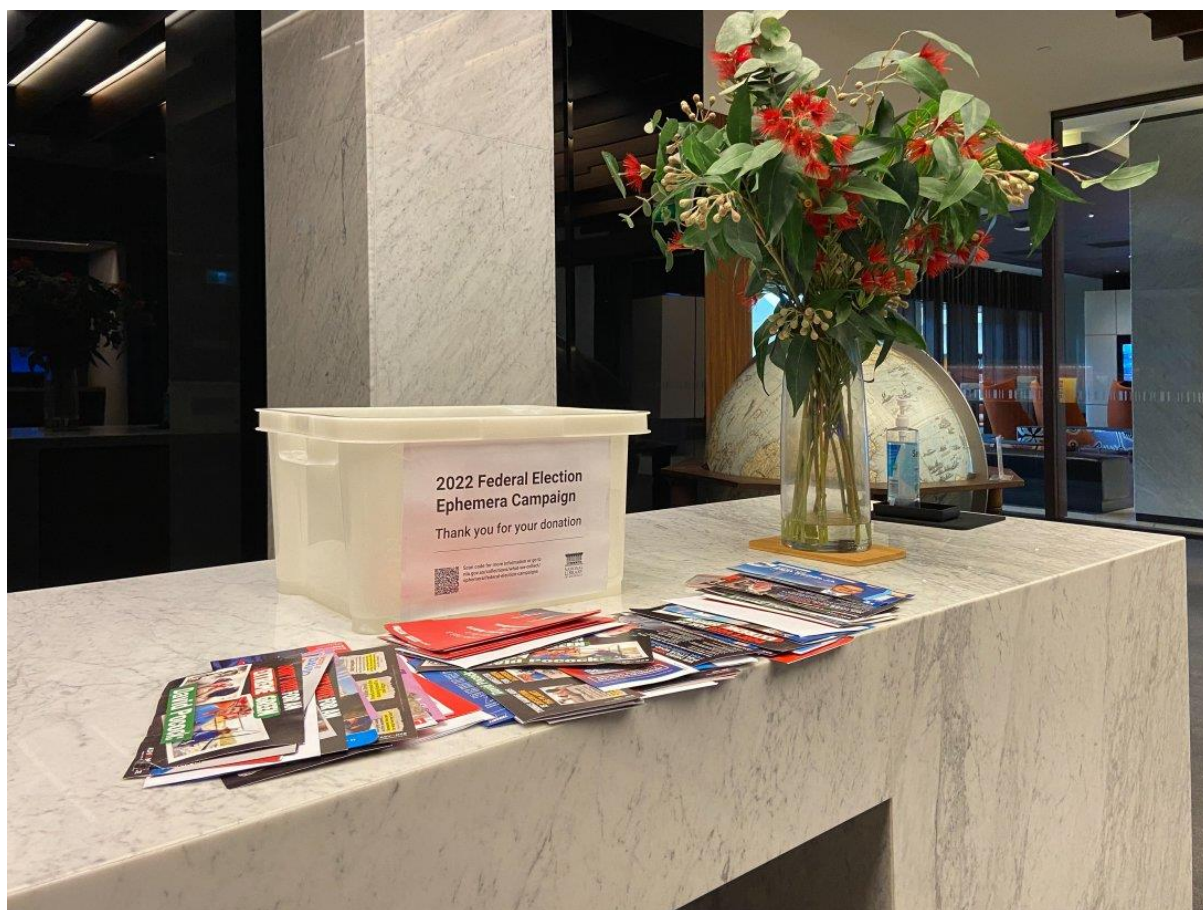
2图书馆主阅览室的收集箱之一

这种呼吁有多种方式——可通过我们的 图书馆馆藏网站 、社交媒体信息和媒体，以及依靠图书馆的读者和支持者发出相关呼吁。此外，我们还向候选人和政党直接发送接洽函。图书馆工作人员一直忙于寻找相关的联络信息，以直接联络个人和政党。事实证明，由于一些细节缺失，我们可能无法接触到尽可能多的候选人和政党。因此，当地民众和社区的参与变得至关重要——他们可以提供来自某位候选人的竞选宣传品，让图书馆拥有整个竞选活动的完整文献记录。