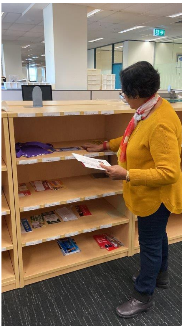
3 一名工作人员正在整理收到的2022年联邦竞选材料

一旦决定接受某些藏品，相关材料将被分门别类（例如，按候选人的姓氏分类），工作人员将作出相应安排，开始列出藏品清单，并将材料放置在保存藏品用的文件夹和资料盒中。然后，这些物品将被置于图书馆的宣传品展示架上，供澳洲民众查看。